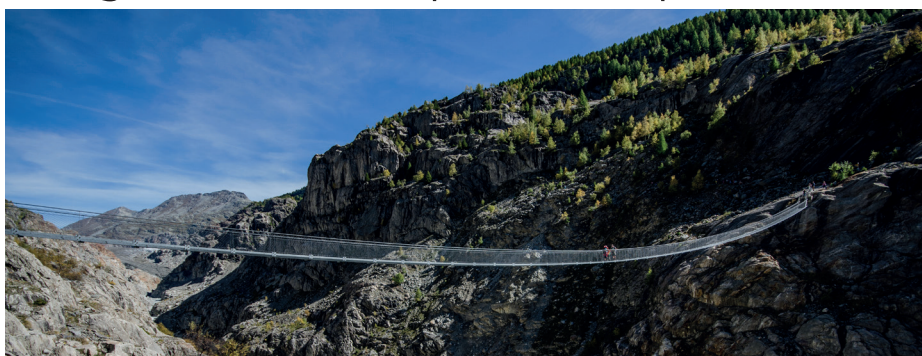
Wanderung über die 124 Meter lange Hängebrücke

Die 124 Meter lange Hängebrücke ermöglicht die direkteste Verbindung und den definitiv spektakulärsten Weg von der Belalp auf die Riederalp. In 80 Meter Höhe führt sie direkt vor dem Gletschertor des Grossen Aletschgletschers über die Massaschlucht und ist ein echtes Wander-Highlight im UNESCO-Welterbe.