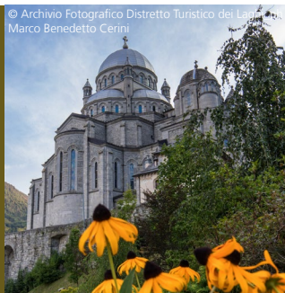
Madonna di Re