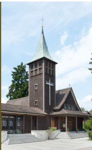
Egg bei Zürich